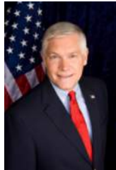
美国国会议员 皮特·涩深丝

“2014年3月21日，我有幸参观一所很棒的学校 - 德州国际领导学校。学校的课程设置和他们对学生领导能力的培养给我留下了极其深刻的影响。我非常期待学生的成功和该校光明的未来。”