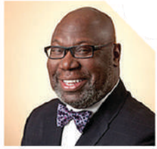
德州教育局专员专家 迈克尔·威廉姆斯

“无论是美国国内还是世界其他国家的学生，都会切身体会到无国界教育的重要性，并不断发展自身的无穷潜力……我们应该感谢像德州国际领导学校这样的学府，是他们让我们的后代立于不败之地。”